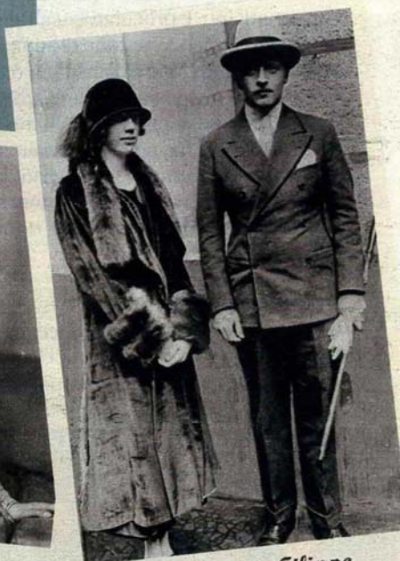
Con il marito Filippo

Germania. Mafalda è felice. I figli sono al sicuro, e finalmente lei rivedrà il marito.