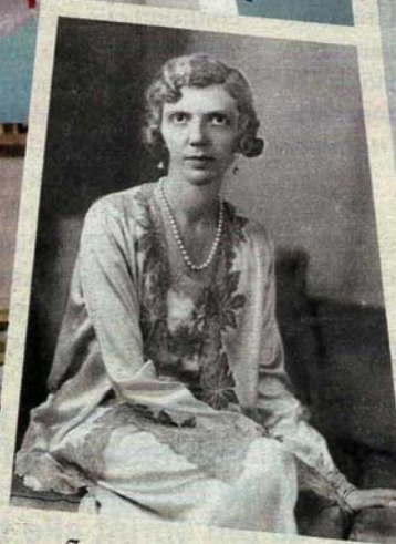
In un ritratto ufficiale