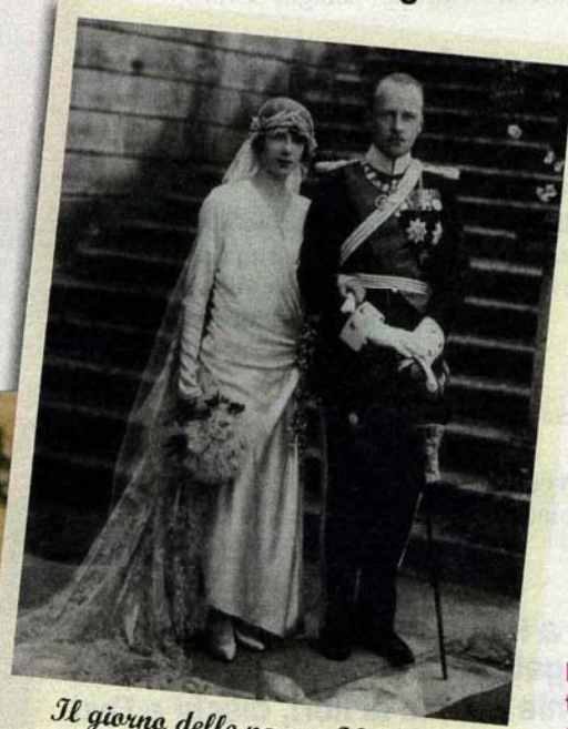
Il giorno delle nozze, 23-9-1925

Mafalda e Filippo erano diversi in tutto, ma l'amore li ha uniti fino all'ultimo giorno