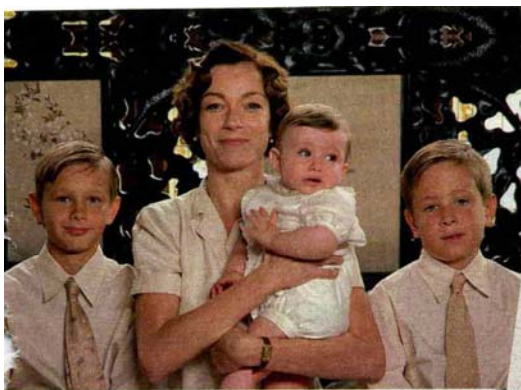
Nella fiction di Canale 5 Mafalda è interpretata da Stefania Rocca. Qui sopra, in un'immagine con i tre figli maschi.

gravemente ammalata. Sua madre l'aveva raggiunta e se l'era portata a Roma. I figli Maurizio, Enrico, Ottone ed Elisabetta, erano tutti nati in Italia, e allevati nella religione cattolica.