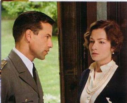
♥ Sopra da sin., Amanda Sandrelli nel ruolo di Ester Sermoneta, una delle migliori amiche di Mafalda; la Rocca con un ufficiale nazista. A ds., la Courrau con il marito Emanuele Filiberto di Savoia e la figlia Vittoria.