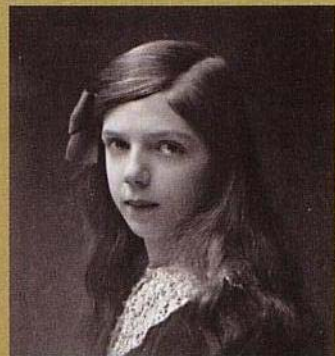
♥ Mafalda (1902-1944), figlia di Vittorio Emanuele III ed Elena di Savoia, in una foto da ragazzina.