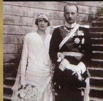
♥ 23 settembre 1925: le nozze, a Racconigi, di Mafalda con il principe tedesco Filippo d'Assia.