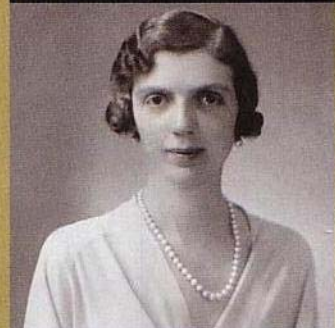
♥ Un ritratto della principessa negli anni Trenta: amava la musica ed era amica di Puccini.