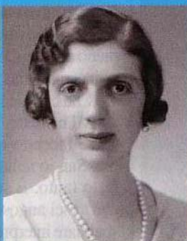
La principessa Mafalda di Savoia (1902-1944).

III e di Elena di Savoia, Mafalda visse la Prima guerra mondiale in prima linea, assistendo i soldati italiani negli ospedali militari insieme alla madre e alle sorelle. La principessa sposò nel 1925 il principe tedesco e tenente dell'esercito prussiano Filippo d'Assia, dal quale ebbe quattro figli. Filippo diventò un ufficiale delle SS, la milizia nazista di Hitler, ma quando,