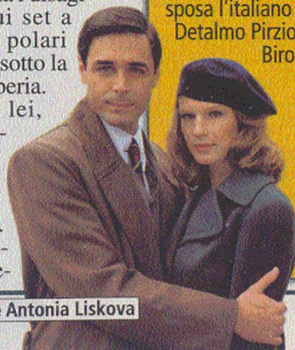
Daniele Pecci e Antonia Liskova